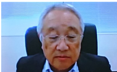
会長挨拶 (津田会長)