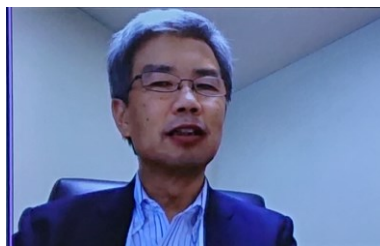
来賓挨拶 (米田九州経済産業局長)