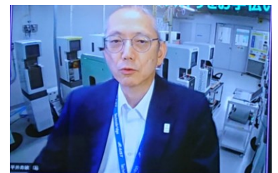
閉会挨拶 (平井副会長)