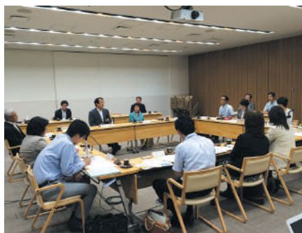
▲九州全域でますます女性活躍推進が活発に

女性達のキャリア支援についても、ミドルマネジメントに対する研修を行ったり、意見交換のネットワークを設けたり、イベントの準備から関わってもらおう等、様々なスタイルが紹介されました。