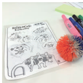
▲ワールド・カフェのテーブル上