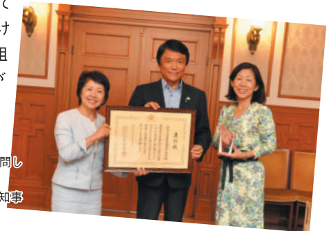
▶7月2日小川福岡県知事を訪問し受賞を報告しました 左：久留共同代表、中央：小川知事 右：松田企画委員会副委員長

女性のチャレンジ支援賞は平成16年度に制定され、女性のチャレンジについて積極的な支援を行い、男女共同参画社会の形成の促進に顕著な貢献が認められる団体・グループを顕