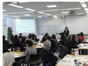
▲荒金氏によるファシリテーション