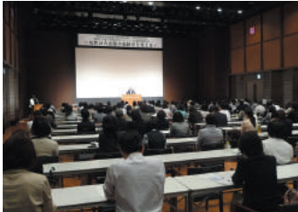
▲二周年式典の会場の様子

全 国に先駆けて女性活躍に取り組んでいる本会議の、二周年記念式典を開催しました（参加者180名）。来賓の大曲昭恵福岡県副知事は女性管理職ネットワーク「WE-Net福岡」一期生として