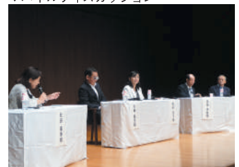
▼パネルディスカッション

3代目の女性の副知事が誕生しているが、当時、あれだけ議論したことが、今では当たり前のように進んでいることに時代の流れを感じる」「ここ4年で子どもが誕生した100人の男性社員のうち12人が育児休暇を取得した。周りの理解が進み、堂々と取得できている」「上司には、部下の家庭環境や休みが取れているのかどうか把握しておくよう伝えている」など、業種は異なっても、組織の成長には人材育成の強化が必要だという点で一致。その上で、女性社員の活躍の幅を広げ、男女ともにワークライフバランスのとれた環境づくりに取り組むことが、新たな発想や働き方の変化を生み出すことを伝えていただきました。