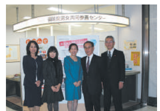
▲静岡経済同友会静岡協議会の視察

●1月29日 静岡経済同友会静岡協議会ひと委員会の4名の方が、本会議を視察。本会議の設立に至る経緯、各部会、WE-Net福岡の活動状況等を説明しました。